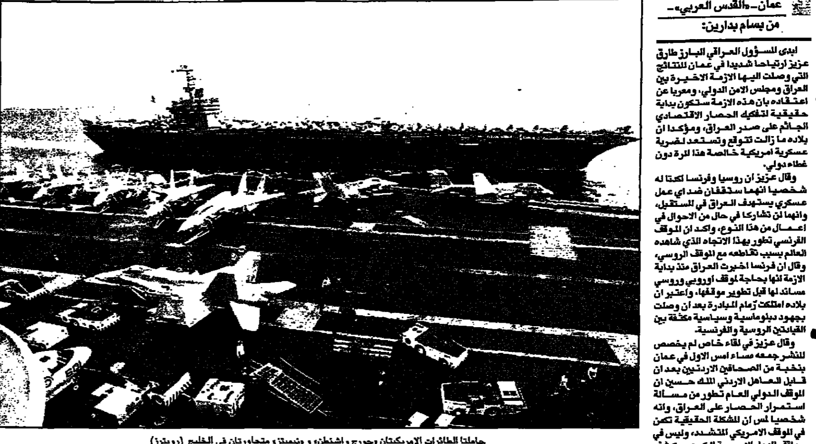
حاملة الطائرات الأمريكيةان جورج واشنطن، ونيويورك، متجاورتان في الخليج

أكد نجاح زيارته لسورية.. وتحدث عن تعهدات روسية وفرنسية. عزيز: مصر وعدت بـ «تطوير» الموقف السعودي تجاهنا. والكويت تمول الحشود الامريكية المتأهبة لضرب العراق.